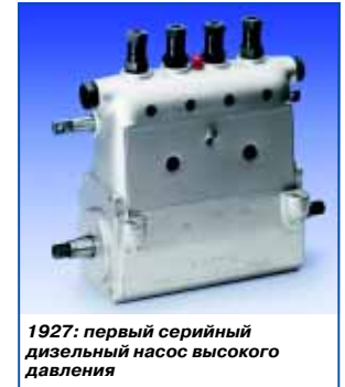
1927: первый серийный дизельный насос высокого давления

1927 г. – топливный насос высокого давления для дизельных двигателей. Хотя Роберт Бош его не изобрел, а лишь усовершенствовал. Но это усовершенствование по-настоящему открыло эпоху дизельных авто: использование гидравлического устройства позволило отказаться от громоздкого