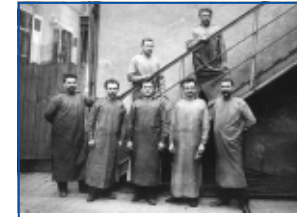
1905: первые мастера фирмы Bosch

По мере развития фирмы Роберт Бош смог нанять новых сотрудников: в 1891 г. у него уже работали десять человек, а в 1892 г. – двадцать пять. Правда, из-за последовавшего затем кризиса штат фирмы сократился до трех человек.оборотный капитал был израсходован почти полностью, и только кредит под гарантии родственников удержал мастерскую на плаву. Скоро предприятию по-