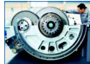
Генераторы от Bosch Rexroth преобразуют вращение ветряков в электрическую энергию. На фото: нижняя часть корпуса генератора

На основе созданного в 1932 подразделения специального машиностроения для собственных нужд, в 1974 году у фирмы появи-