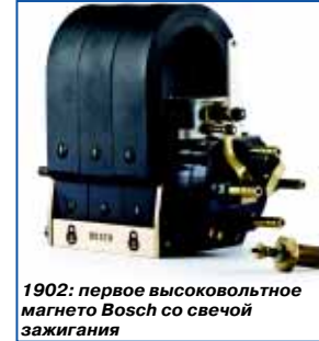
1902: первое высоковольтное магнето Bosch со свечной зажиганием