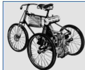
1897: трицикл с низковольтным магнето Bosch

В 1897 году Бош по заказу компании «Даймлер» адаптировал устройство зажигания от магнето на двигатель транспортного средства — трицикла De Dion Bouton. Успешно справившись с этой задачей, Бош решил проблему зажигания для высокооборотных автомобильных двигателей внутреннего сгорания – одну из главных технических проблем становления автомобильной техники.