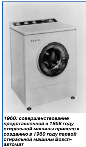
1960: совершенствование представленной в 1958 году стиральной машины привело к созданию в 1960 году первой стиральной машины Bosch-автомат

В 1958 ряды бытовой техники Bosch пополнились еще и стиральными машинами.