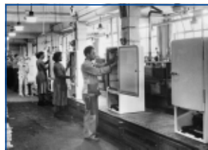
1952: конвейер по сбору холодильников на заводе Bosch