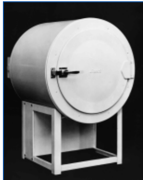
1933: первый бытовой холодильник Bosch

В 1933 году Bosch шокировала общественность, представив свой первый бытовой холодильник.