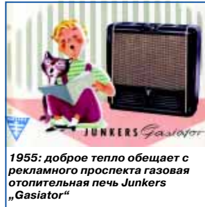
1955: доброе тепло обещает с рекламной проспекта газовая отопительная печь Junkers „Gasiator“

В 1956 Bosch со слоганом «Свежесть, доступная в любое время» анонсирует свою первую морозильную камеру. В этом же году уже миллионный домашний холодильник покидает конвейер.