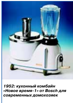
1952: кухонный комбайн «Новое время-1» от Bosch для современных домохозяек

В 1950 г. Bosch выпускает первый кухонный миксер и кухонный комбайн с эмальированной чашей и корпусом «В помощь хозяйке». В этом же году выходит первая кухонная плита Bosch.