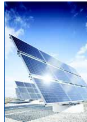
Следящая за положением солнца солнечная батарея с кристаллическими модулями от Bosch Solar Energy

лось направление «Промышленное оборудование» для внешних клиентов.