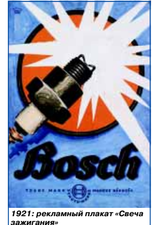
1921: рекламный плакат «Свеча зажигания»

кардинально изменил сам подход к системе зажигания.