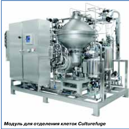
Модуль для отделения клеток Culturefuge