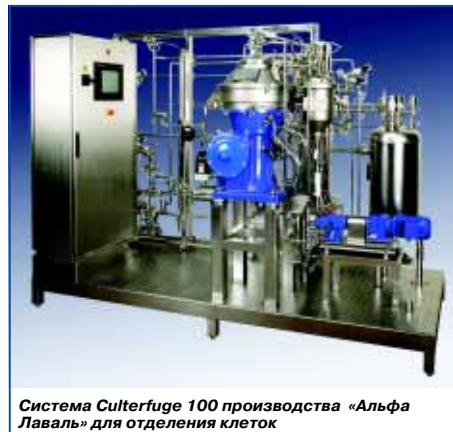
Система Culterfuge 100 производства «Альфа Лаваль» для отделения клеток

Путем предотвращения дополнительного лизиса во время ускорения можно увеличить производительность сепаратора без ущерба для требуемого результата сепарации. Кроме того, дальнейшая очистка целевых белков упрощается и может осуществ-