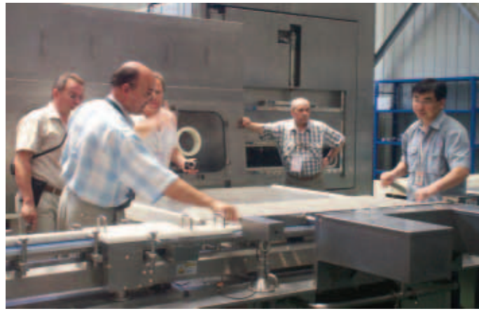
Осмотр разных моделей загрузочных систем в одном из цехов завода

Концерн на приемку оборудования и ознакомления с возможностями фирмы ТОФФЛОН, как одного из потенциальных партнеров Концерн в будущих проектах.