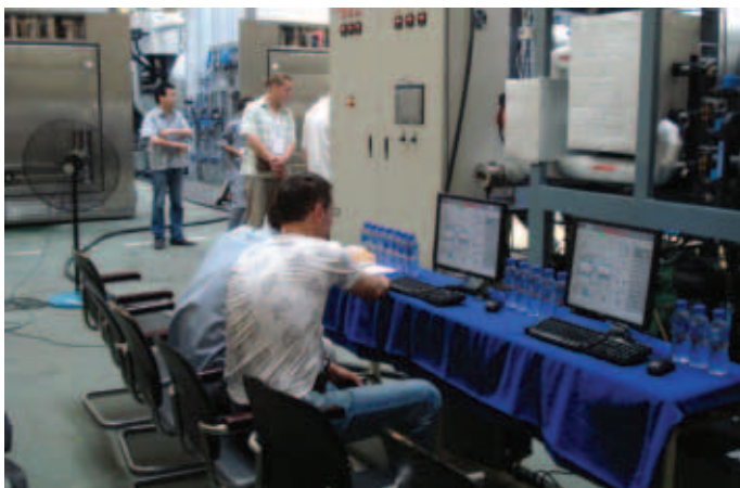
В процессе приёмки лиофильных установок Lyo-5