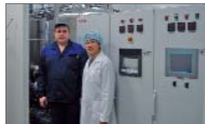
Специалисты сервисной службы TOFFLON во время запуска на ФГУП «Курская биофабрика» лиофильной установки LYO-5 (SIP/CIP), 2011 г.

Так, например, в 2011 г. наша сервисная служба принимала активное участие в запуске линий розлива Bosch на предприятиях «Фармак» (г. Киев), «Здоровье народа»