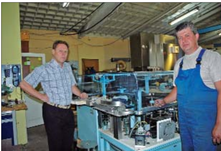
В мастерской компании ООО «Холдинг Фармтех» в Москве. Капитальный ремонт инспекционной машины Eisai для ООО МЦ «Эллара», 2010 г.

специалистов запуску в эксплуатацию, сервисному гарантийному и постгарантийному обслуживанию лиофильного оборудования фирмы TOFFLON. Сегодня шефмонтаж проводят специалисты компании-изготовителя совместно с инженерами «Холдинг Фармтех». Наш партнер – компания «ФермСтройМонтаж» – также активно участвует в шефмонтаже ус-