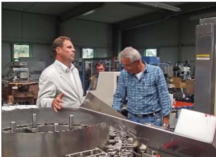
Специалисты компании «Холдинг Фармтех» в мастерской немецкого партнера за обсуждением объема сервисных работ по восстановлению машины мойки флаконов Bosch RRU 3040 для российского заказчика, 2011 г.

ных ампул, флаконов, картриджей, шприцев;